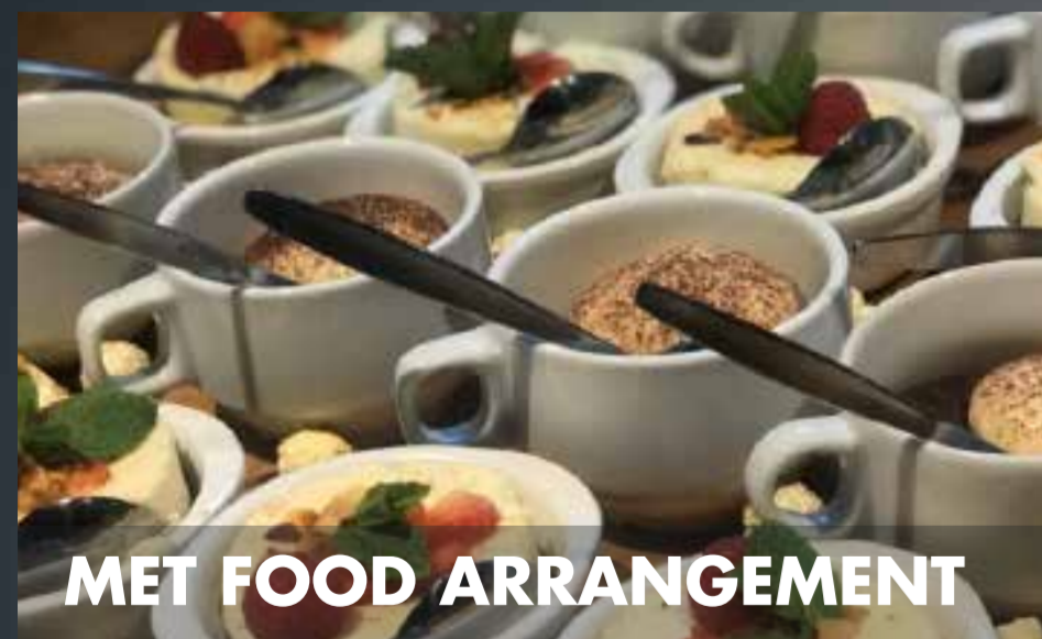
MET FOOD ARRANGEMENT